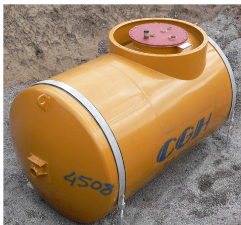
Forankring af 5 m 3 jordtank med 2 stk. galvaniserede forankringsbånd og 4 stk. nedstøbte ankere