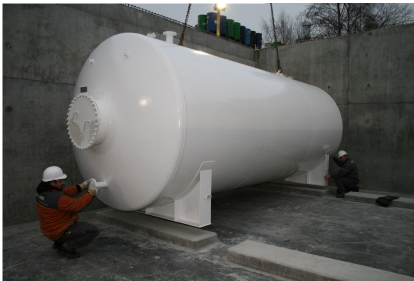
30 m 3 enkeltvægget tank med en diameter på 2,5 meter