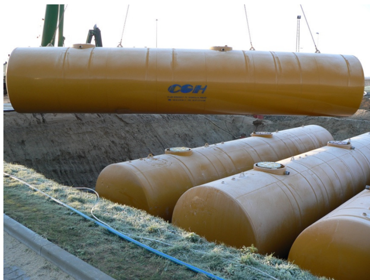
4 x 100 m 3 dobbeltvægede jordtanke til transportcenter

DN600 mandekarm med ramme for montage af nedstigningsskakt. Størrelsen af rammen tilpasses de forskellige modeller af skakte.